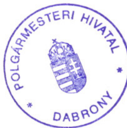
Bedő Gábor ig. főea.